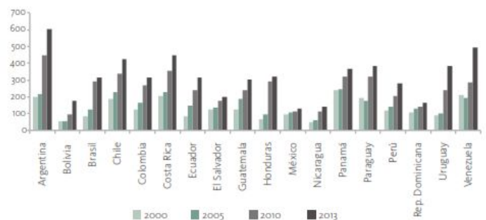
Figura 1. Salario mínimo mensual de México y otros países de América Latina, 2000-2013 (US dólares corrientes)

De hecho, en 2014 la Cámara de Diputados analizó y aprobó una propuesta de desvinculación del salario mínimo, pero la Cámara de Senadores trabó el proceso. Dada la fuerte injerencia del partido político en el poder sobre las decisiones de dicha Cámara, se preveía que la desvinculación siguiera congelada durante algún tiempo en el Legislativo.